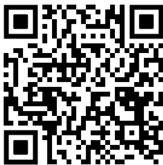
文化产品设计素材